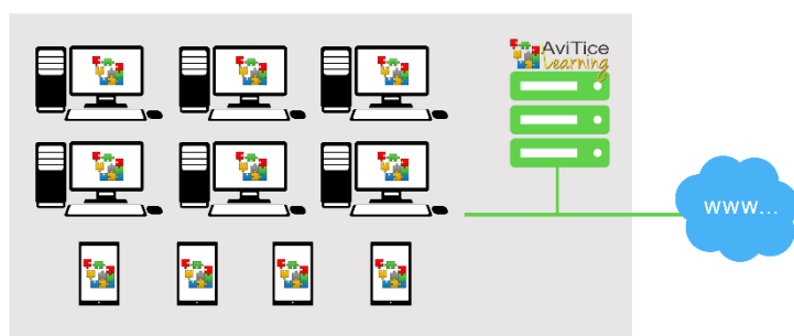
Cas d'une installation sur vos serveurs

AviTice Learning s'installe sur vos serveurs (sous forme de machine virtuelle) ou sur le Cloud (peut être géré par nos services en mode redevance), ou en collaboration avec un hébergeur tiers (Azure, OVH...)